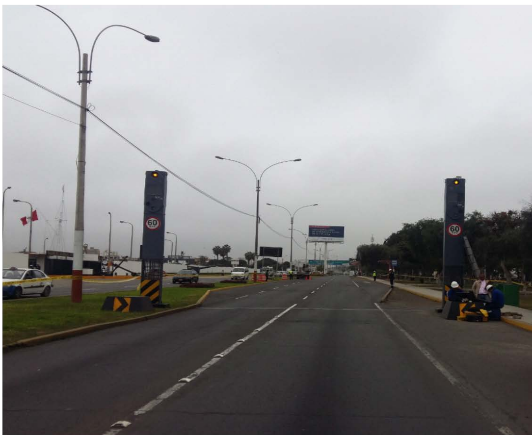
ILUSTRACIÓN DEL MEDIDOR DE VELOCIDAD CON NÚMERO DE SERIE 1913;1914 ( * )