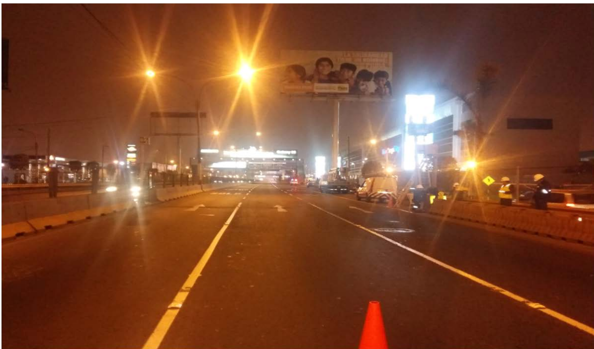
ILUSTRACIÓN DEL MEDIDOR DE VELOCIDAD FIJO CON NÚMERO DE SERIE 3042 ( * )

ID. N: CALDE13J Serie: 3042 Carril: Derecho - Centro